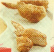
tori no teba (2 pcs) Rp 22.000