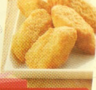
shrimp roll (5 pcs) Rp 22.000