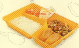
Rp 33.000 シンプルセット照り焼き simple set teriyaki 1 CT + 2 ECR + Nasi