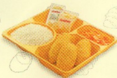
Rp 18.000 シンプルセット simple set 2 3 SR + Nasi