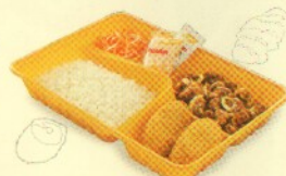
Rp 33.000 シンプルセット照り焼き simple set teriyaki 2 CT + 2 SR + Nasi