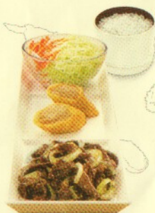
Rp 39.500 simple set beef teriyaki 1 BT + 2 ECR + Nasi