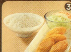
Rp 19.500 2 ECR + 2 SR + Nasi