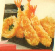
tempura moriwase Rp 37.000