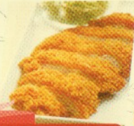
chicken katsu Rp 25.000