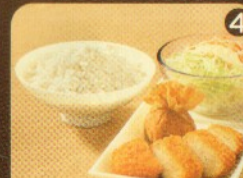
Rp 19.500 1 Ekkado + 1 TB + Nasi