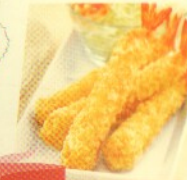
ebi furai (4 pcs) Rp 28.500