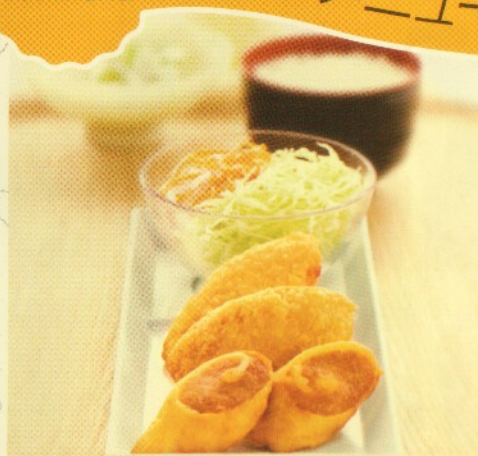
バリューセット value set