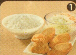
Rp 19.500 1 Ekkado + 3 ECR + Nasi