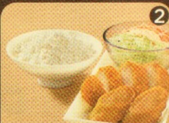
Rp 19.500 2 ECR + 1 TB + Nasi