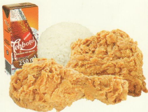
2 PTG FRIED CHICKEN +NASI Rp 32.727,- + TEH BOTOL 250ML