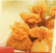
ekkado (5 pcs) Rp 30.000