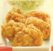
crispy kaarage (5 pcs) Rp 29.000