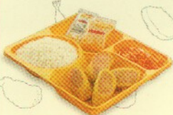
Rp 18.000 シンプルセット simple set 1 4 ECR + Nasi