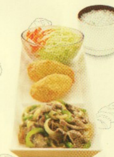
Rp 39.500 simple set beef yakiniku 2 BY + 2 SR + Nasi