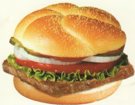
SINGLE BEEF BURGER Rp 29.091,-