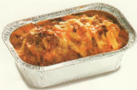
POTATO PIE CHEESE Rp 28.182,-