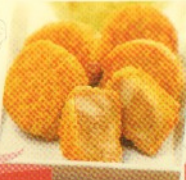
spicy chicken (5 pcs) Rp 25.000