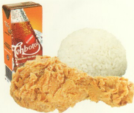
1 PTG FRIED CHICKEN +NASI Rp 23.636,- + TEH BOTOL 250ML

Wendy's melayani pesanan dalam jumlah besar untuk rapat, arisan, pesta, syukuran ataupun acara spesial lainnya.