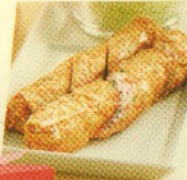
kani roll (2 pcs) Rp 25.000