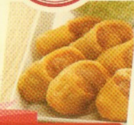
egg chicken roll (6 pcs) Rp 22.000