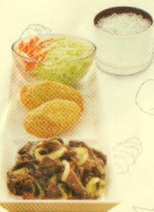
Rp 39.500 simple set beef teriyaki 2 BT + 2 SR + Nasi