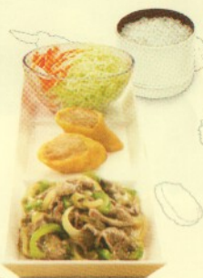
Rp 39.500 simple set beef yakiniku 1 BY + 2 ECR + Nasi